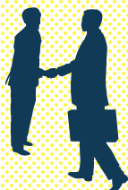
ビジネスマッチング