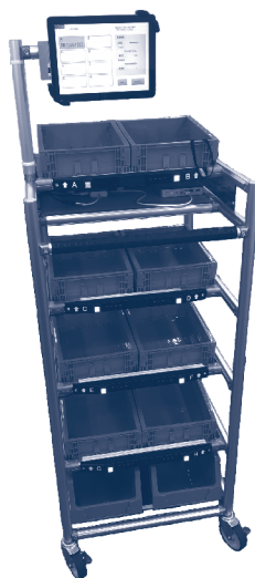
マルチピッキングカートシステム PS-1000

さらに顧客の各倉庫の棚レイアウトマップ作成と、各製品ロケーションの位置をX,Y座標に変換するツールを独自開発することにより、導入時間短縮と経費削減ができシステムの拡販ができるようになりました。