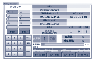
ピッキングガイドタブレット表示