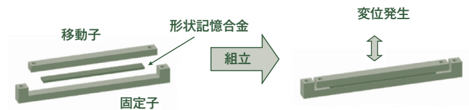
青電舎が発明したクリック感発生用デバイスのイメージ