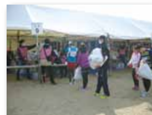
たましん職員も荷物預かり係のボランティアとして参画