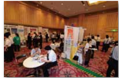
多摩の物産&輸入品商談会