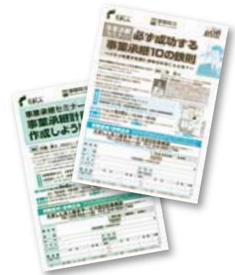
事業承継セミナーチラシ