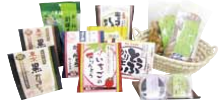
「東京アベック」開発商品