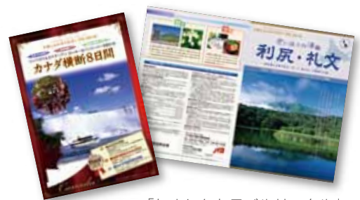
「たましんトラベルサークル」 パンフレット