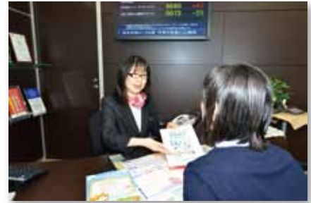
すまいるプラザにて