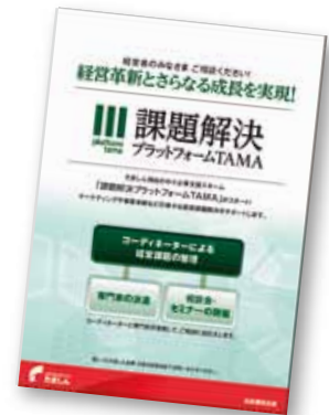
課題解決 プラットフォームTAMA パンフレット