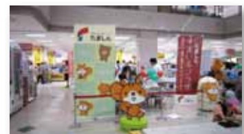
保険なっ得フェア

下記日程・場所にて、保険の見直しおよび加入に関する情報提供や相談会を行う「保険なっ得フェア」と「保険なっ得デー」を開催しました。