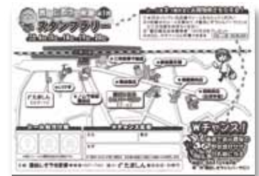
「豊田じぞう宅配便スタンプラリー」台紙