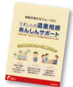
「遺産相続あんしんサポート」パンフレット

相続に係る課題解決に取り組むため、各種手続き方法のご案内や司法書士、弁護士、税理士といった専門家との連携を行い、総合的な提案を行っています。