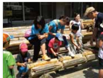
東京都檜原都民の森にて