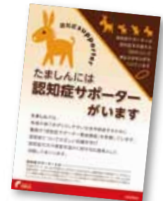
「認知症サポーター」ポスター

平成24年8月23日をもって、たましんの全営業店職員(約1,700名)が、認知症サポーター養成講座の受講を終了しました。自治体等と協力し、認知症の方やその家族を支援するボランティアとして、誰もが安心して暮らせる地域社会づくりをめざしています。