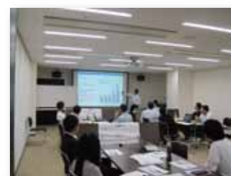
TAMA NEXT リーダープログラム 講義風景