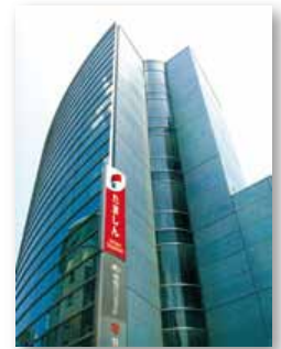
ブルームセンター全景