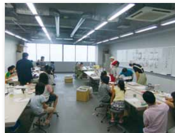
夏休み科学体験教室