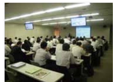
海外展開セミナー講義風景