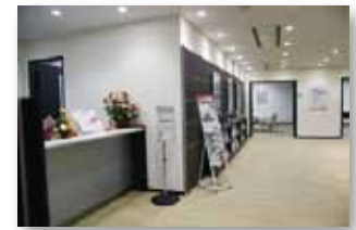
win プラザ 多摩センター