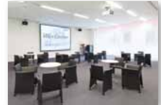
Winセンター(ラウンジ)