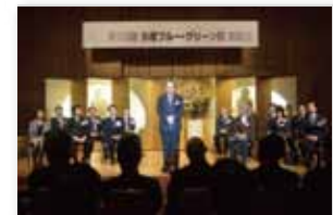
第10回多摩ブルー・グリーン賞 表彰式