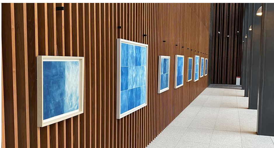
ご利用例 (越智也実「Dialogue/Monologue」2020 年)